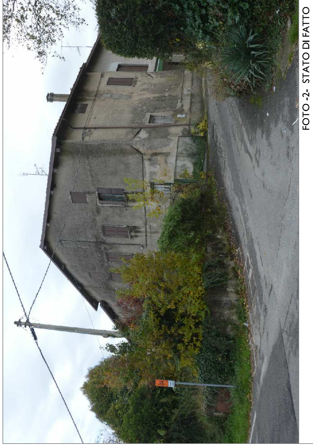
FOTO -2- STATO DI FATTO