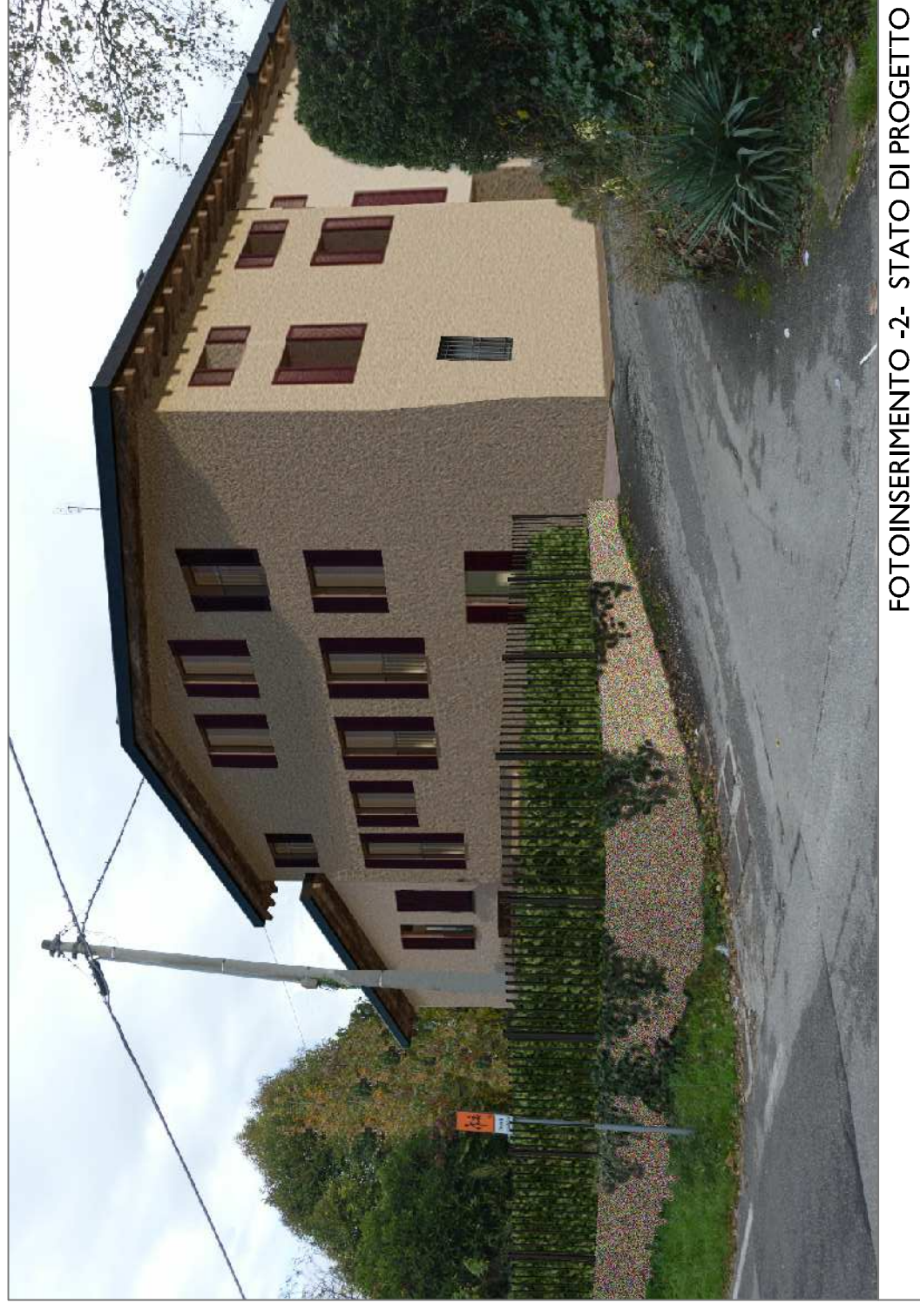
FOTOINSERIMENTO -2- STATO DI PROGETTO