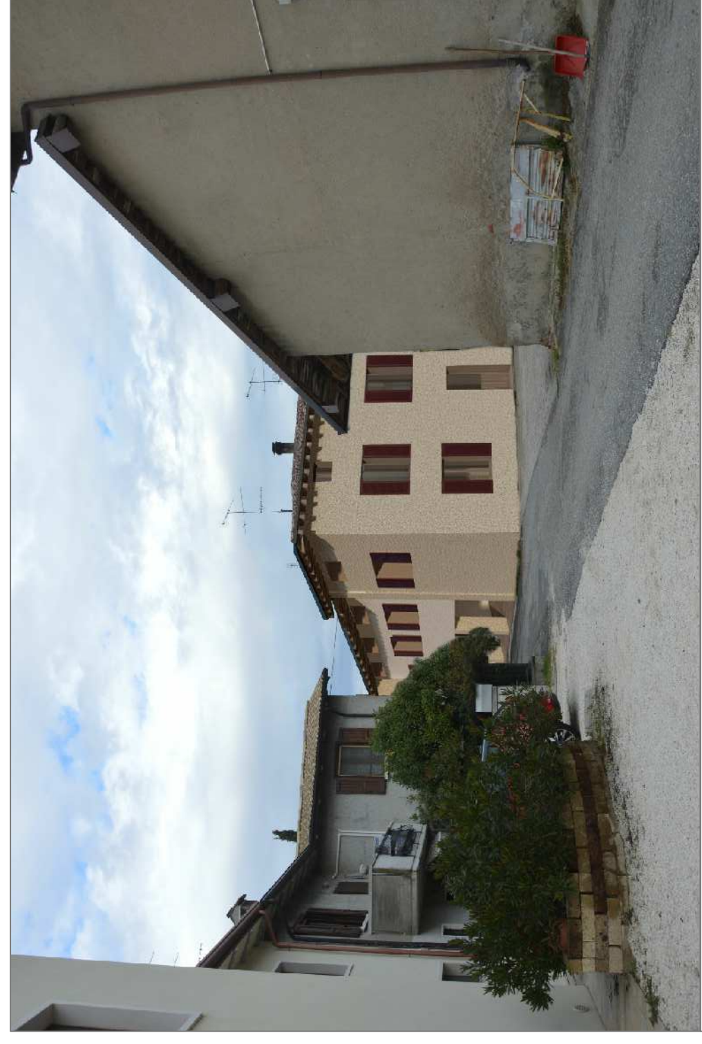
FOTOINSERIMENTO -3- STATO DI PROGETTO