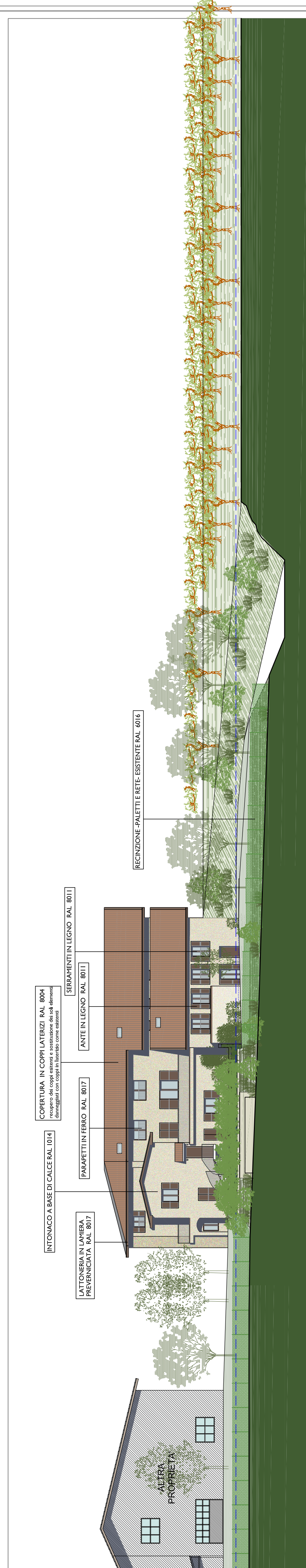
SEZIONE A-A - STATO DI PROGETTO