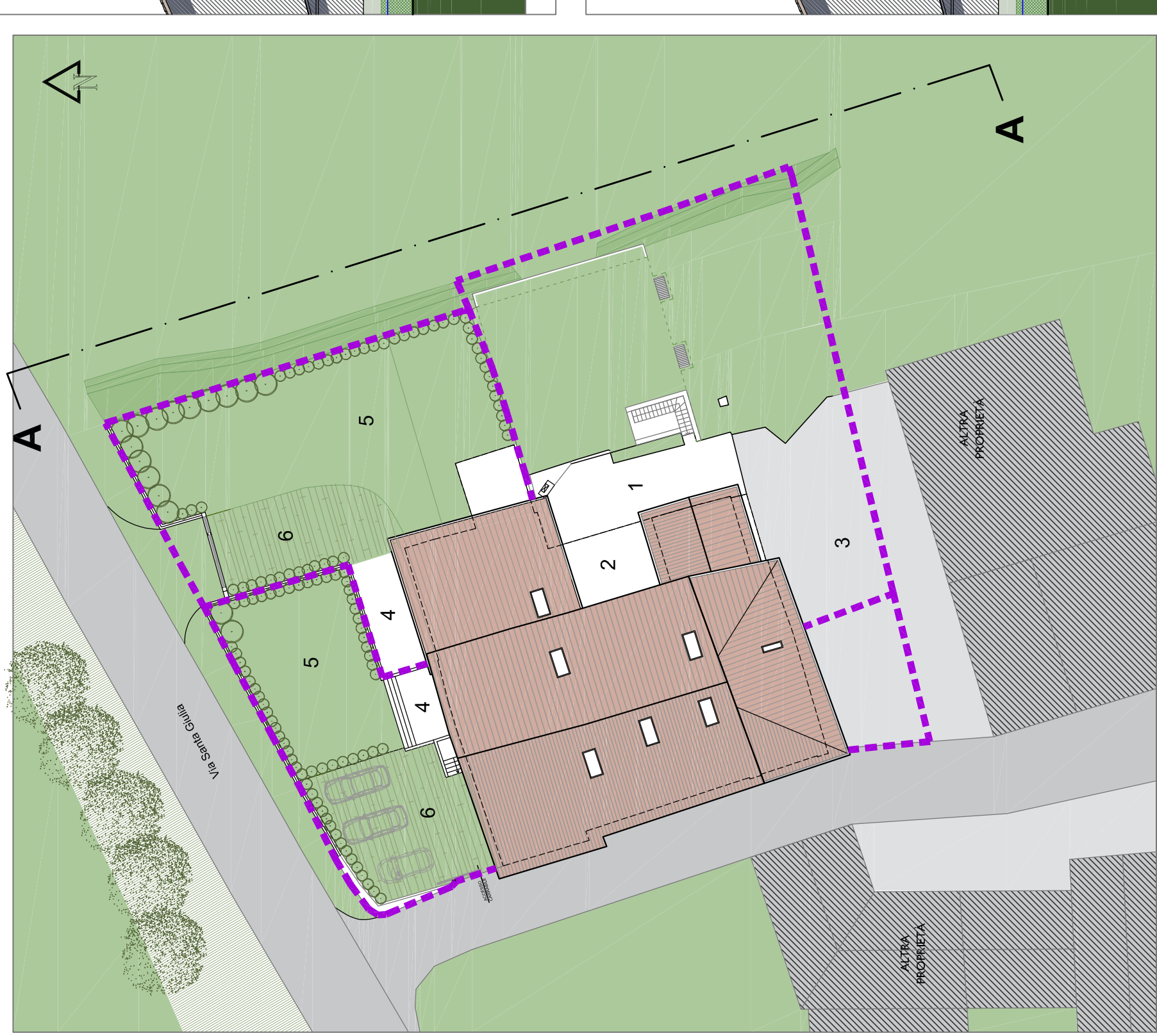
PLANIMETRIA GENERALE - STATO DI PROGETTO