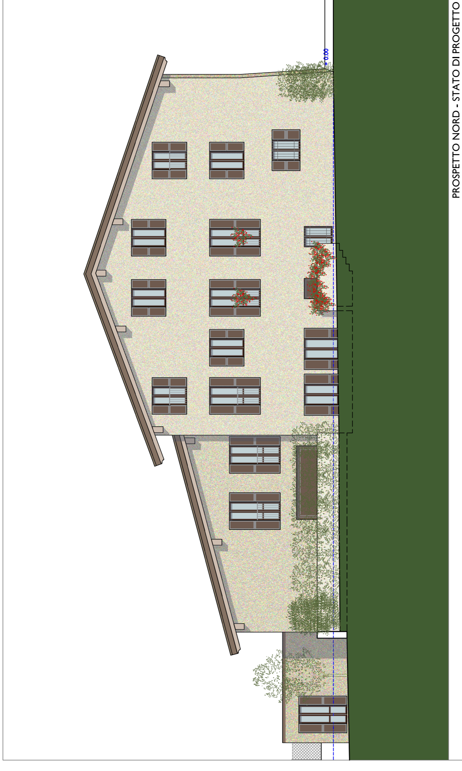
PROSPETTO NORD - STATO DI PROGETTO