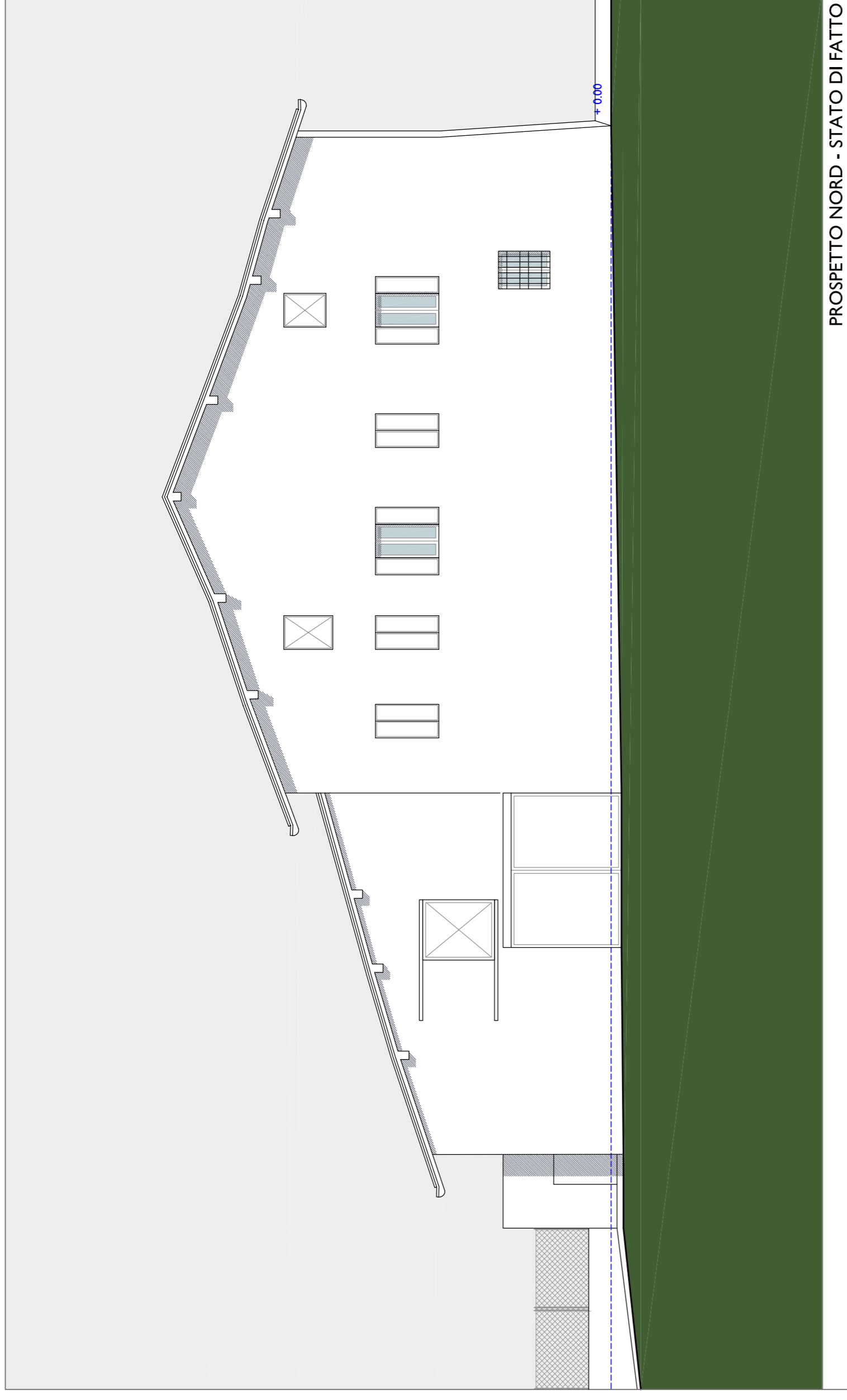
PROSPETTO NORD - STATO DI FATTO