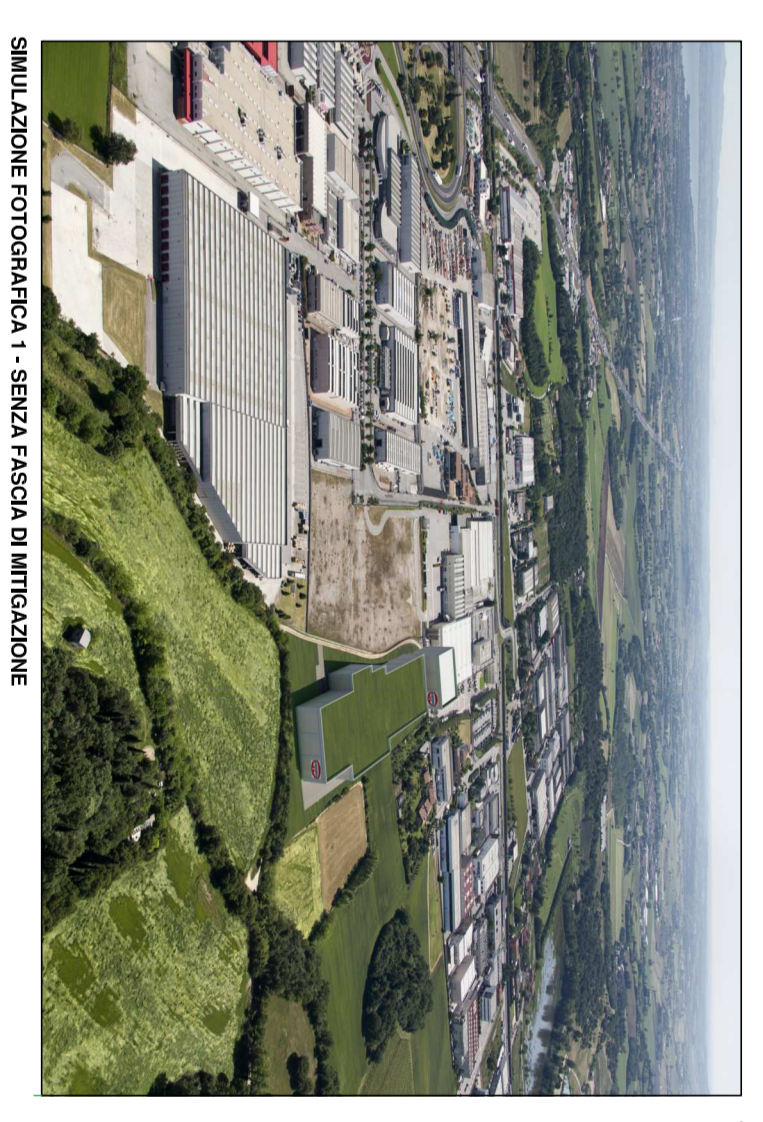
REALIZZAZIONE FOTOGRAFICA - SENZA FACCELA DI IMPIANTAZIONE