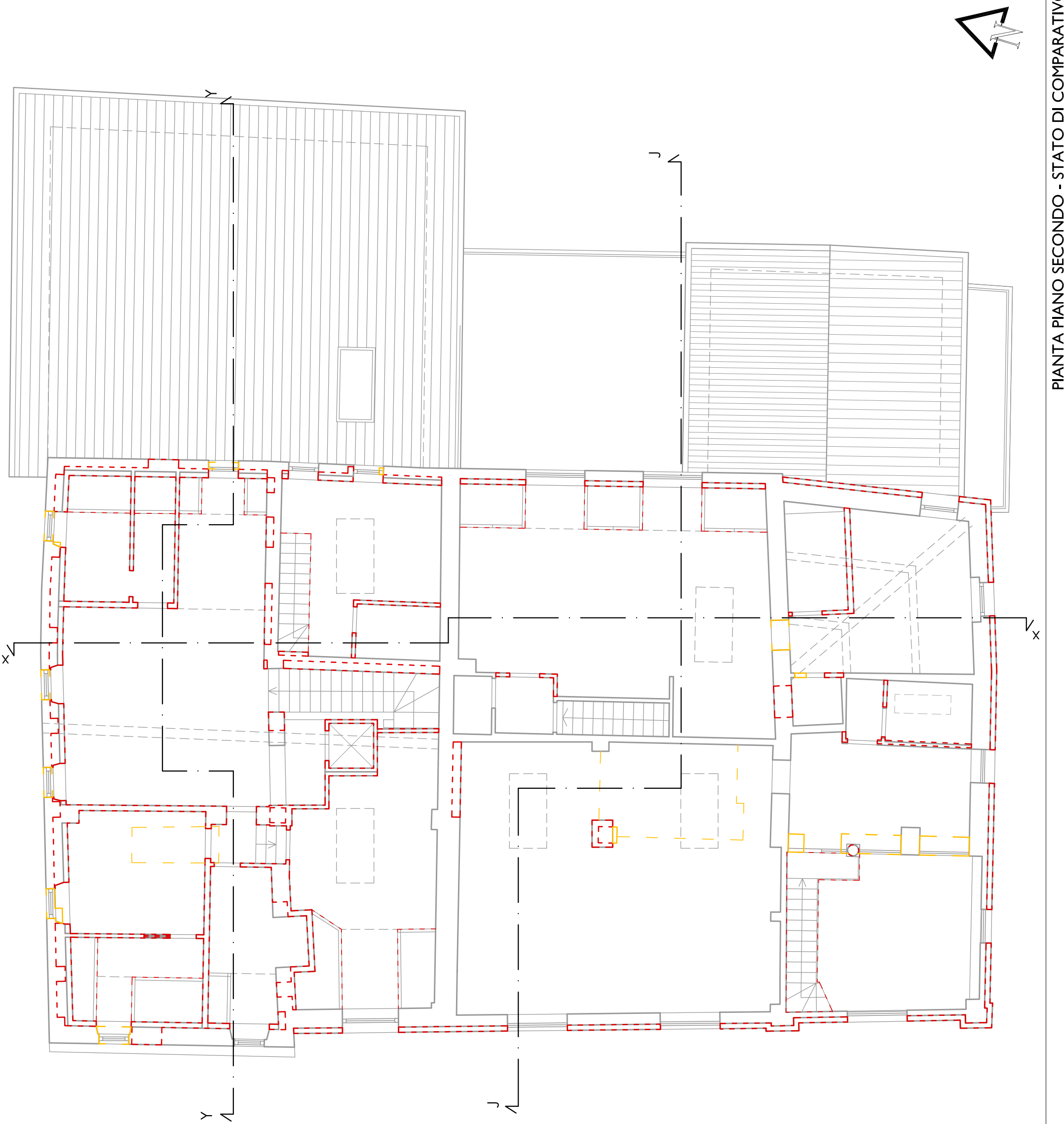
PIANTA PIANO SECONDO - STATO DI COMPARATIVO