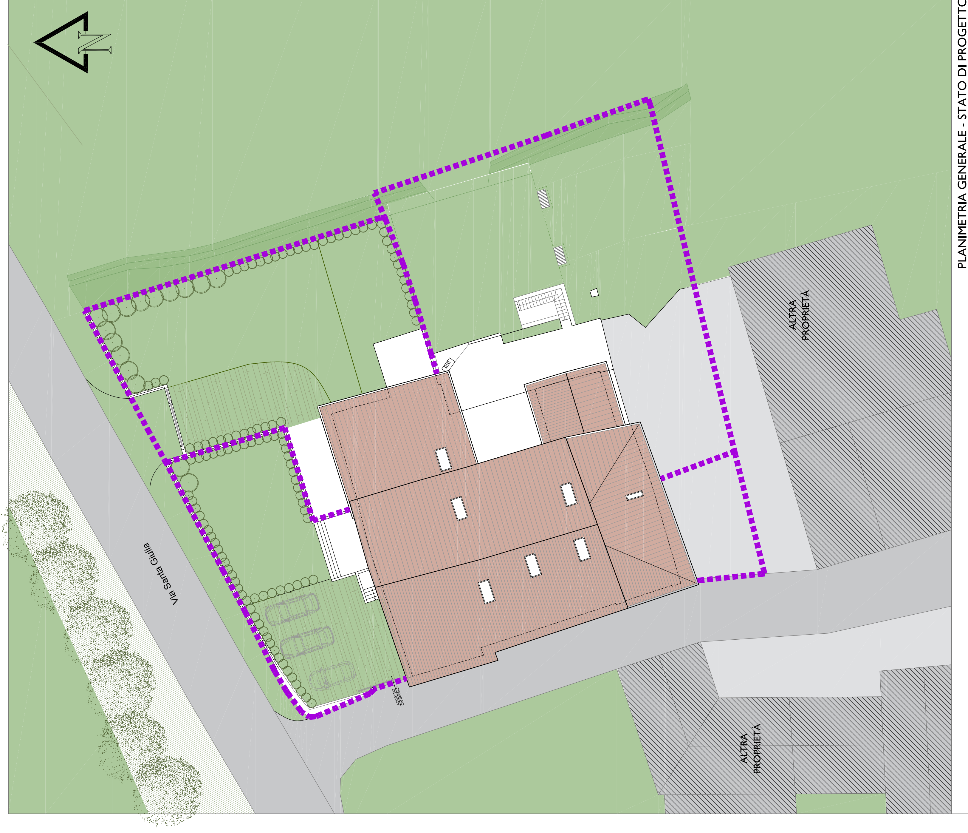
PLANIMETRIA GENERALE - STATO DI PROGETTO