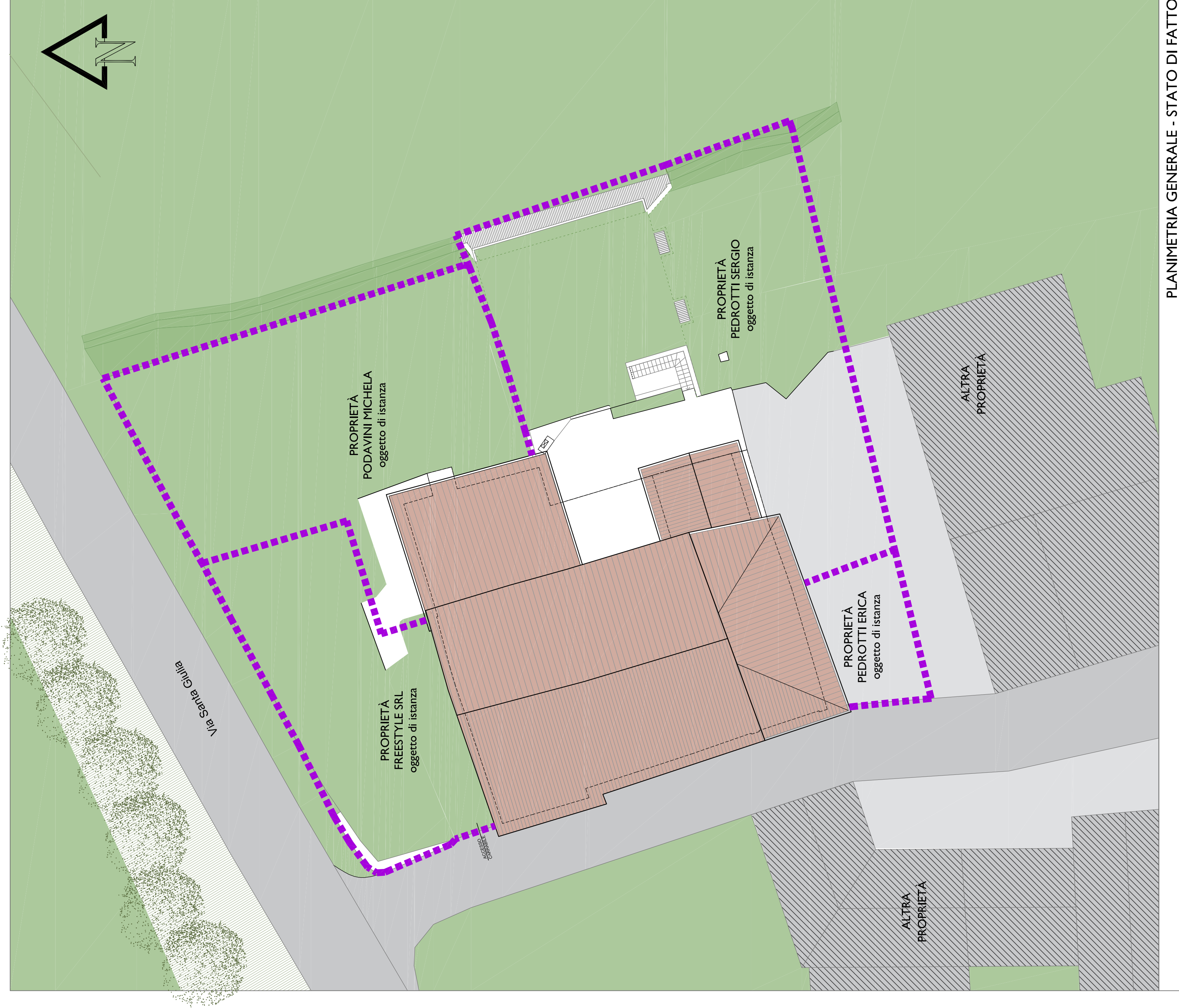
PLANIMETRIA GENERALE - STATO DI FATTO