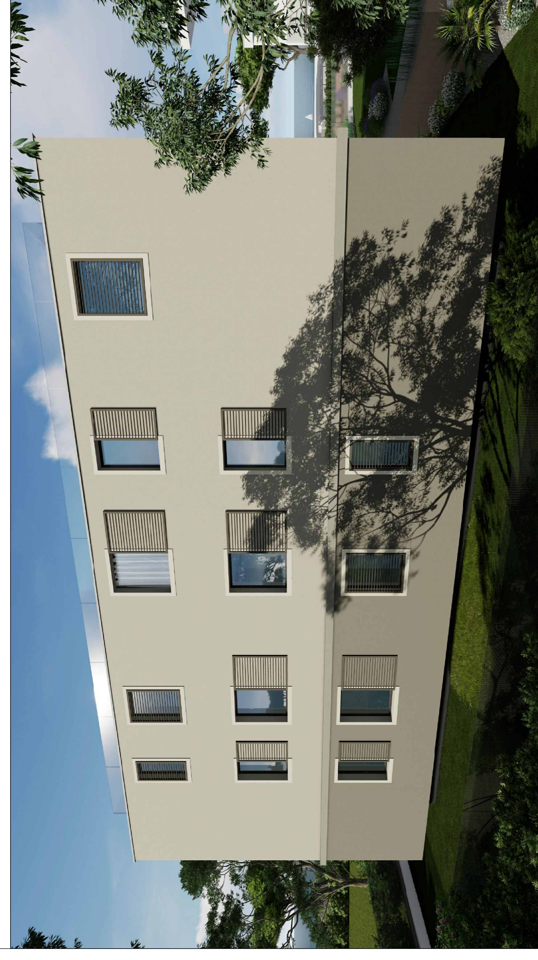
FOTOSIMULAZIONE (vista 1) - SOLUZIONE B