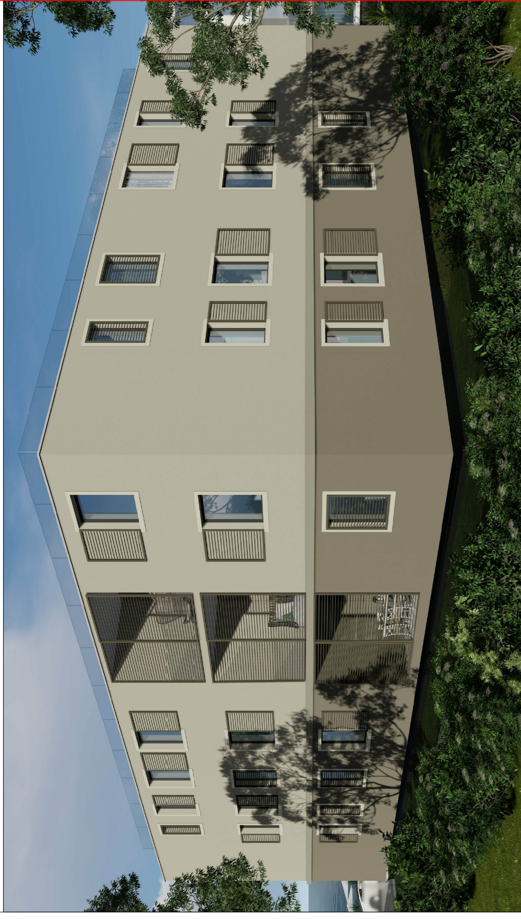
FOTOSIMULAZIONE (vista 2) - SOLUZIONE B