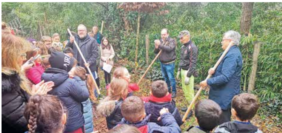
LA GIORNATA DELL'ALBERO EDIZIONE 2019

dell'agricoltura e la organizzazione in concomitanza della Fiera Agricola di mostre sulle attrezzature agricole. Abbiamo progettato e realizzato col Cai di Desenzano il percorso escursionistico 801 e il percorso naturalistico delle colline moreniche 803. Infine segnalo l'adesione e il relativo finanziamento per una cifra di circa 200mila euro ai due Bandi del Gal Garda (Gruppo azione locale) e Colli Mantovani per la realizzazione di un Info Point. Abbiamo valorizzato un percorso ciclabile che va dalle campagne lonatesi ai colli mantovani con pannelli informativi interattivi e stazioni di ricarica di bici elettriche. Abbiamo aderito al Progetto di Garda Uno 100% Urban Green Mobility con l'installazione di due stazioni di ricarica di auto elettriche ed il noleggio di una stessa.