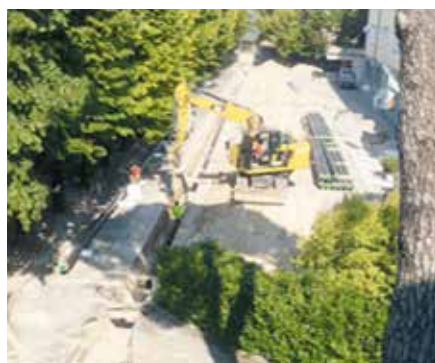
TELERISCALDAMENTO ZONA ITIS

Ristrutturazione cappella cimiteriale presso il campo santo di Maguzzano, automazione cancello carraio par-