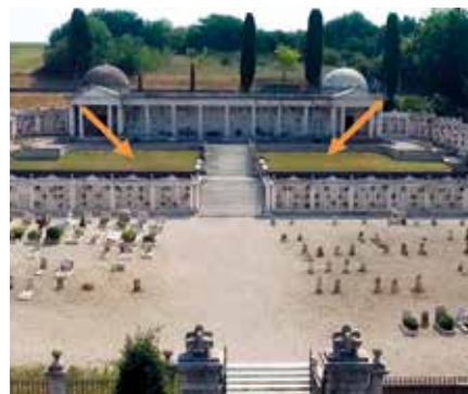
AMPLIAMENTO CIMITERO ESENTA

Sostituzione degli infissi esterni presso la scuola primaria don Milani, manutenzione delle strutture in legno lamellare del nuovo palazzetto dello sport, asfaltatura strade comunali, messa in sicurezza e miglioramento della viabilità e sostituzione infissi esterni presso scuola secondaria Tarello, completamento edificio socio ricreativo nella frazione di Sedena, ampliamento cimitero di Esenta, realizzazione marciapiede di collegamento tra le frazioni di Castel Venzago e Centenaro, parcheggio nei pressi della scuola primaria di Esenta, adeguamento antisismico scuola primaria di Centenaro, inserimento tra gli interventi che verranno realizzati da Acque