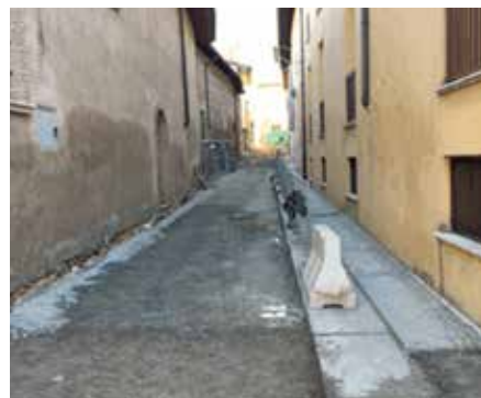
RIPRISTINO IN VIA PAROLINO