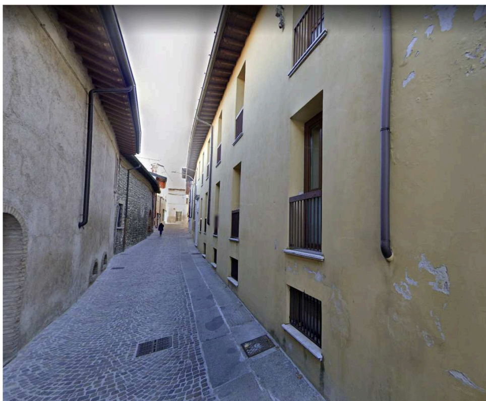
facciata su via Marconi