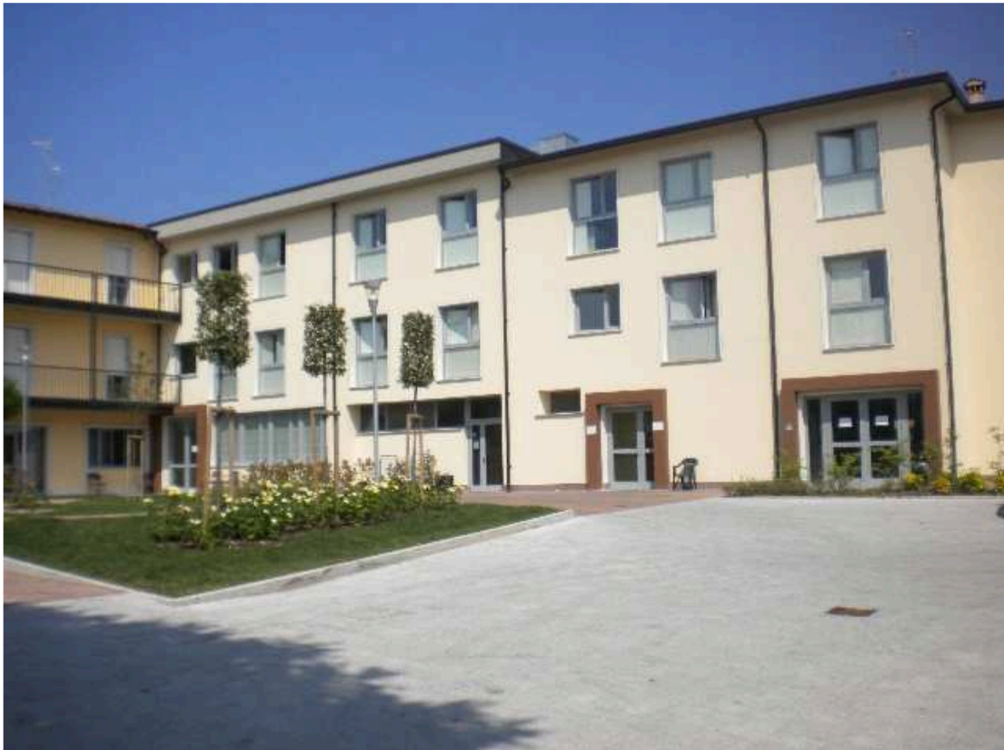
Prospetto verso il cortile