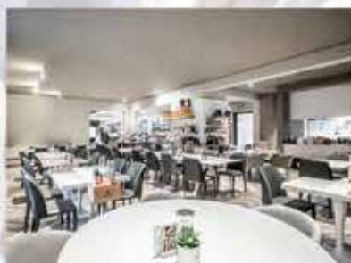
KUOKI MULTIFOOD Lonato d/G www.kuoki.it