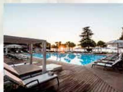
SPLENDIDO BAY LUXURY SPA RESORT Padenghe s/G www.splendidobay.com