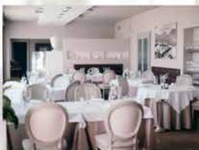
RISTORANTE IL RIVALE L'OSTERIA DI PALAZZO Padenghe s/G www.ilrivale.it