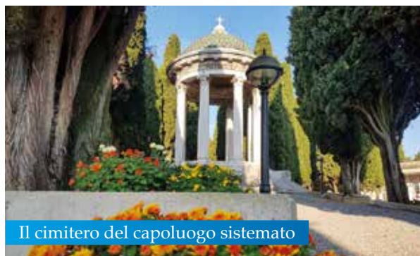
Il cimitero del capoluogo sistemato

afflusso, per un totale di circa 140 cestini su tutto il territorio di Lonato del Garda; sono stati posizionati anche i contenitori per la raccolta delle batterie esauste di colore differente e nelle prossime settimane verranno anche posizionati 20 contenitori per l'apposita raccolta dei mozziconi di sigaretta. L'intenzione dell'Amministrazione e dell'Assessorato è quella di introdurre anche il servizio di raccolta dei rifiuti ingombranti su prenotazione.