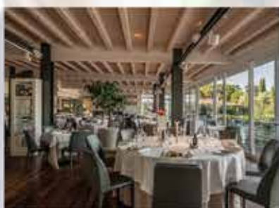
RISTORANTE AQUARIVA Padenghe s/G www.aquariva.it

IL NOSTRO BRAND È PASSIONE SACRIFICIO PROFESSIONALITA'