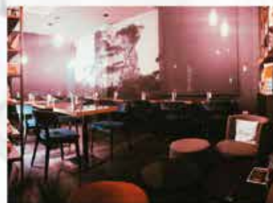
HONORE' LOUNGE BAR Desenzano d/G www.honore.it