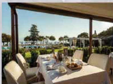
BBAY BISTROT AND BAR AMERICAINA Padenghe s/G www.bbaybistrot.com