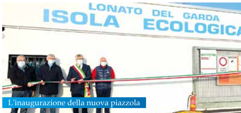
L'inaugurazione della nuova piazzola