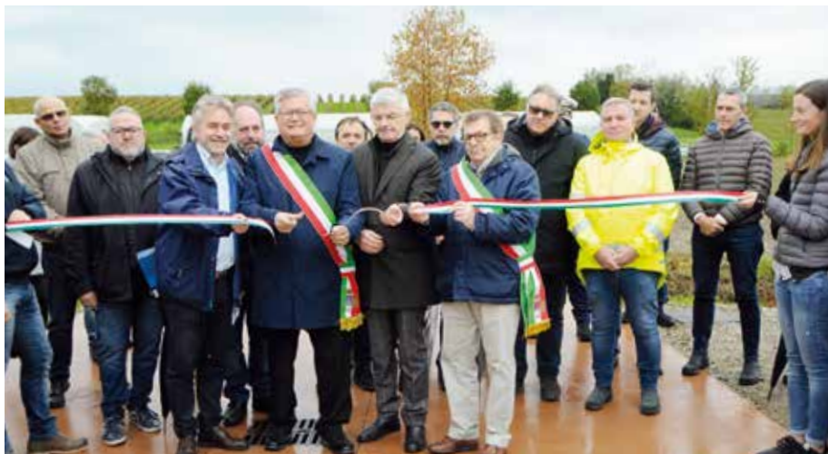
L'INAUGURAZIONE DEL NUOVO DEPURATORE DI CENTENARO

mento: Grigliatura fine (n°1 unità con predisposizione per seconda macchina per il futuro ampliamento a 3000 AE); Dissabbiatura (1 unità); Trattamento biologico per la rimozione dell'azoto (1 unità); Sedimentazione secondaria (1 unità); Disinfezione chimica (1 unità); Digestione anaerobica dei fanghi (1 unità). Le unità di trattamento comuni ai due lotti sono già dimensionate per una potenzialità di 3.000 AE. Tali fasi comprendono i pretrattamenti iniziali, la disinfezione finale e la linea di trattamento dei fanghi. L'impianto è inoltre dotato di automazioni per garantire una flessibilità gestionale e per garantire il rispetto costante dei limiti allo scarico.