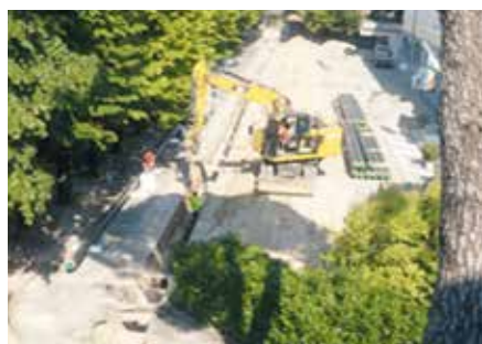
TELERISCALDAMENTO ZONA ITIS

Alcune opere infatti non sono state realizzate, anche per problematiche burocratiche, ma in compenso ne sono state eseguite altre di grande importanza. Come si dice di solito, di necessità è stata fatta virtù e utilizzando le stesse risorse che normalmente sono impegnate per le spese correnti di ogni anno, ossia per la normale gestione amministrativa, abbiamo investito sul patrimonio comunale ottenendo un notevole incremento dello stesso e inoltre un enorme beneficio per la comunità in termini di risparmio energetico e quindi anche di benessere ambientale. Alcuni esempi che desidero sempre ricordare e la trasformazione a led e l'incremen-