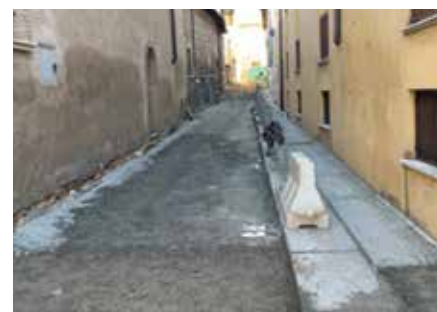
RIPRISTINO IN VIA PAROLINO

Con l'occasione in centro sono stati rifatti i sottoservizi che collegano Piazza Martiri della Libertà a via Filzi e sono state ripristinate, ove possibile, e in parte rifatte le pavimentazioni esistenti. Non nascondo che tutti questi lavori che hanno impegnato le strade comunali abbiano immancabilmente creato disagi alla circolazione e ai residenti, e pertanto ci scusiamo e ringraziamo per la pazienza, ma riteniamo che i risultati ottenuti ripaghino ampiamente il disagio. Basti pensare che in termini molto semplici, le opere realizzate in questi anni corrispondono agli effetti benefici, sull'aria che respiriamo e sul clima, di un bosco di circa 330.000 mq. (100 più bresciani) costituito da circa 8.000 alberi. Il 20 dicembre verrà dato ampio risalto a questi interventi, in occasione di un apposito evento di inaugurazione del primo tratto di teleriscaldamento.