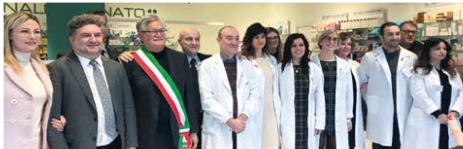
IL PERSONALE DELLA FARMACIA CON LE AUTORITÀ

La farmacia comunale San Giovanni Battista di Lonato del Garda, realizzata nel 2015 all'esterno dell'ingresso centrale de Il Leone Shopping Center, ora cambia posizione e amplia gli spazi passando da 110 a 220 metri quadri, comprensivi del necessario magazzino per lo stoccaggio dei medicinali. La nuova posizione del punto vendita è a ridosso dell'ingresso principale, quello a Nord, e godrà di un parcheggio riservato antistante l'entrata della farmacia e anche di una viabilità dedicata per rendere ancora maggiore la fruibilità del servizio nei giorni di grande affluenza del centro commerciale. Grazie alla collaborazione con l'Amministrazione comunale guidata da Roberto Tardani, la farmacia aperta quattro anni fa dispone di spazi maggiori, per rispondere alle crescenti esigenze degli utenti. La farmacia, completamente rivisitata al suo interno, ha subito tre giorni di chiusura prima dell'apertura per permettere il trasloco di tutti i prodotti all'interno del nuovo spazio. Il punto vendita ha riaperto i battenti nella nuova posizione ieri, giovedì 5 dicembre e, anche in questo caso, seguirà gli orari di apertura del centro: è aperto sette giorni su sette, domeniche comprese, dalle 9 alle 22. Un servizio fondamentale per la comunità lonatese, ma anche per le migliaia di clienti-pazienti che ogni giorno passano dal centro e che, già in questi primi