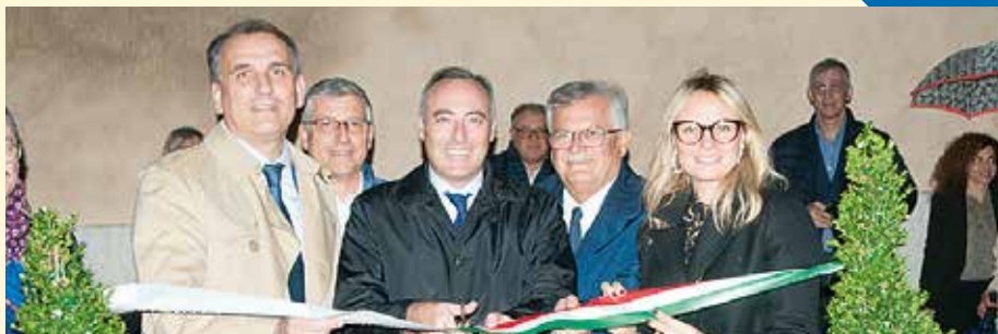
IL TAGLIO DEL NASTRO DEI NUOVI ALLOGGI PROTETTI