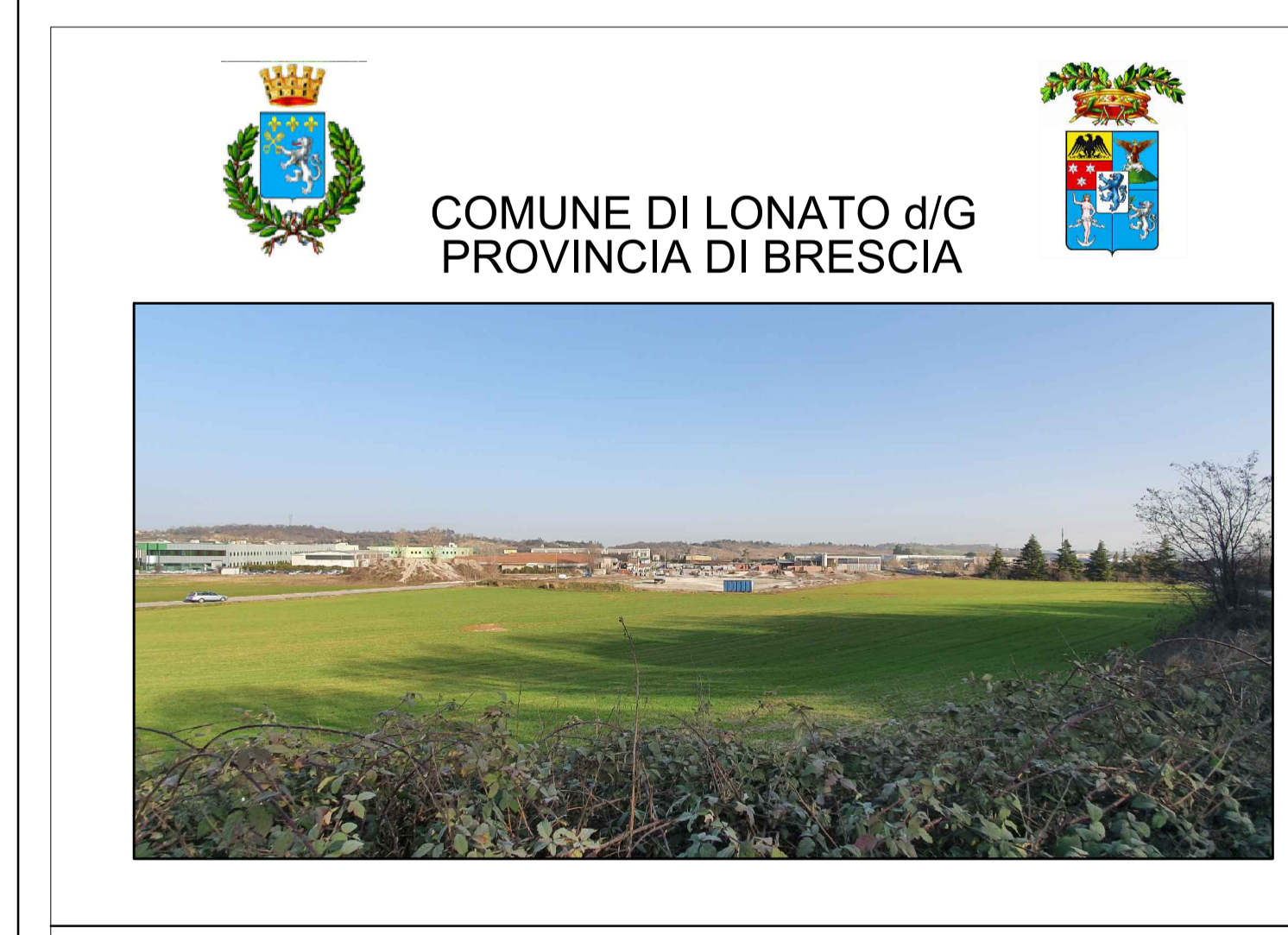
PIANO DI LOTTIZZAZIONE "TIRACOLLO TRE UMI 1" Comune di Lonato - via Tiracollo Fg. 47 m.n. 124p - 125p - 466