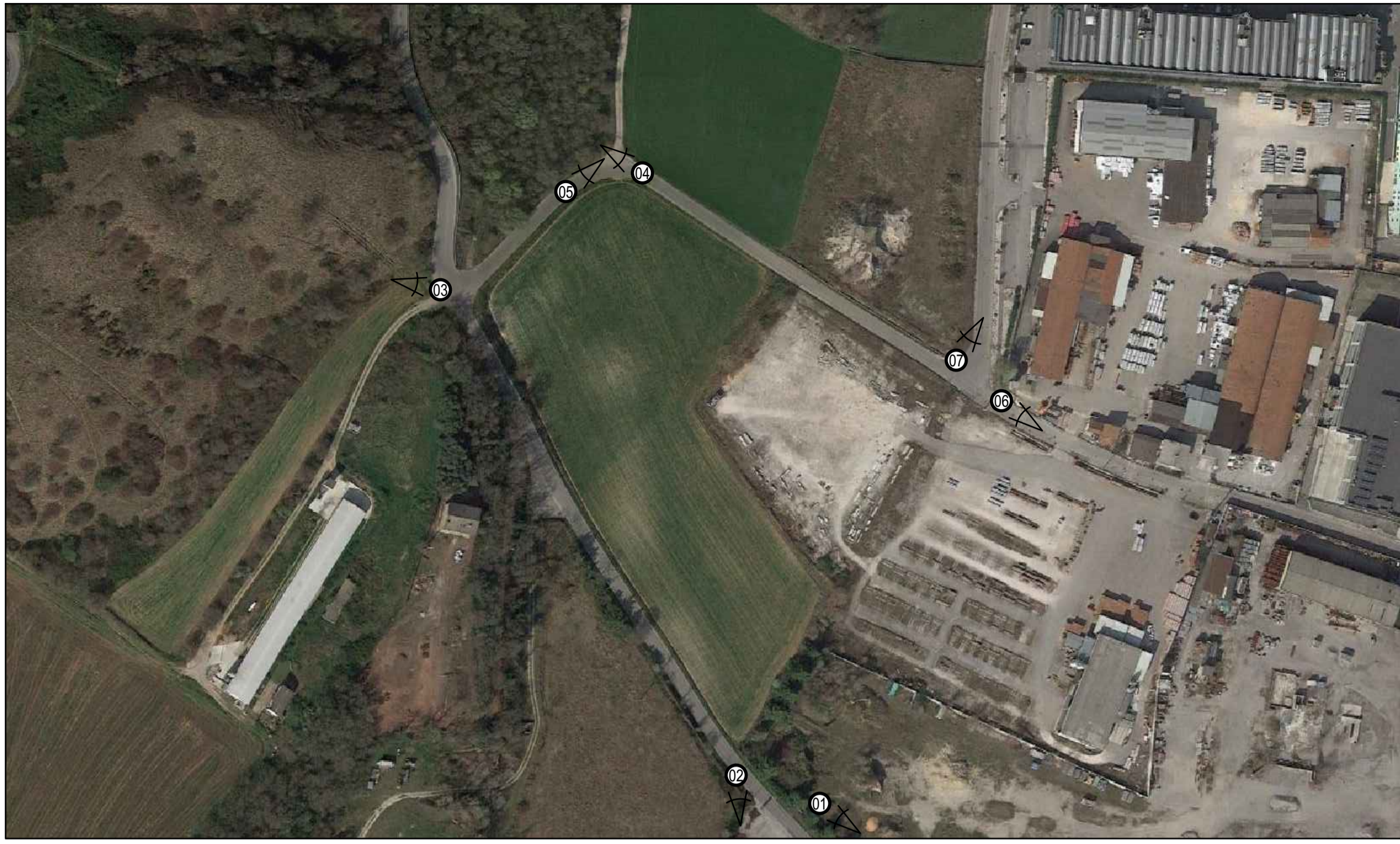
ORTOFOTO scala 1:2 000