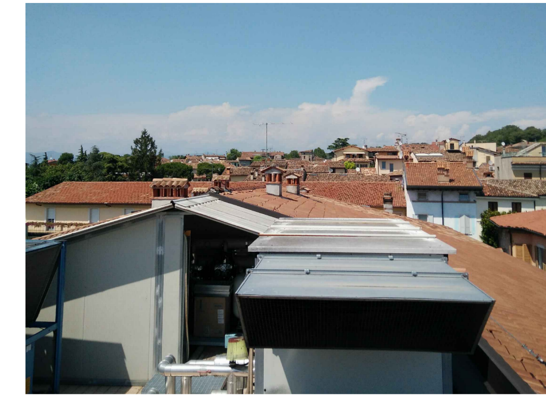
vista copertura - stato di fatto