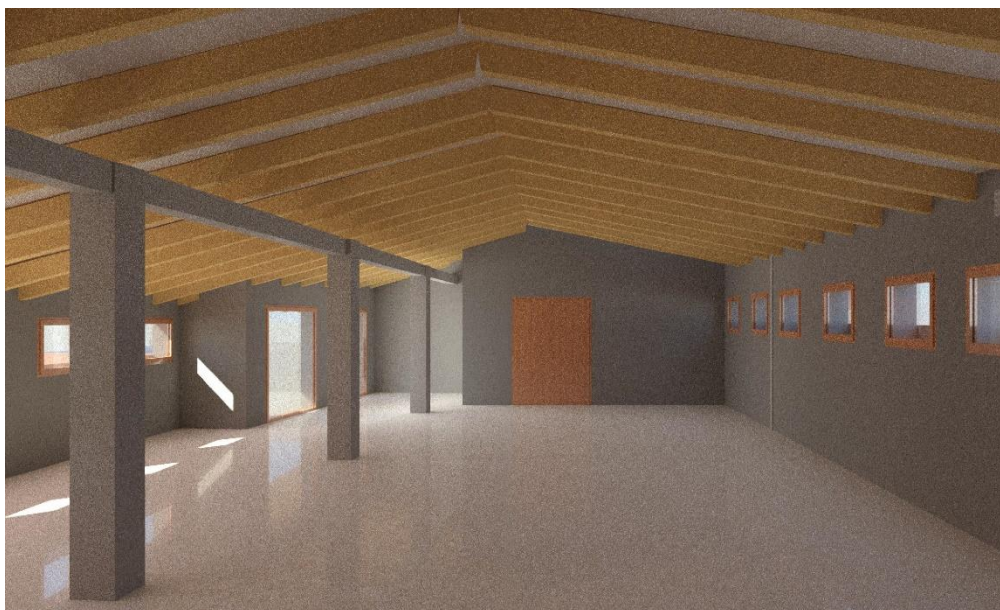
Vista 5 - interno