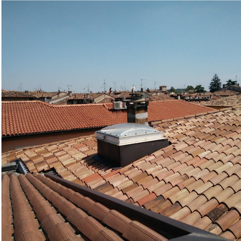
Vista 3 – Copertura, lucernario