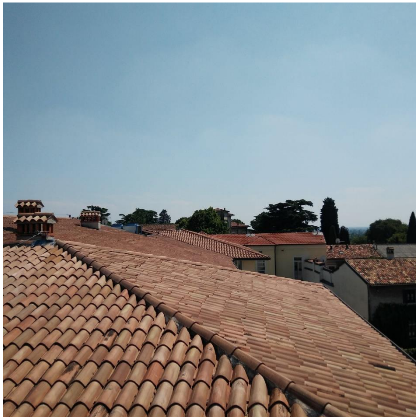
Vista 4 - Copertura