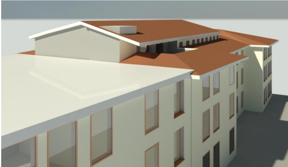
Vista 3- copertura