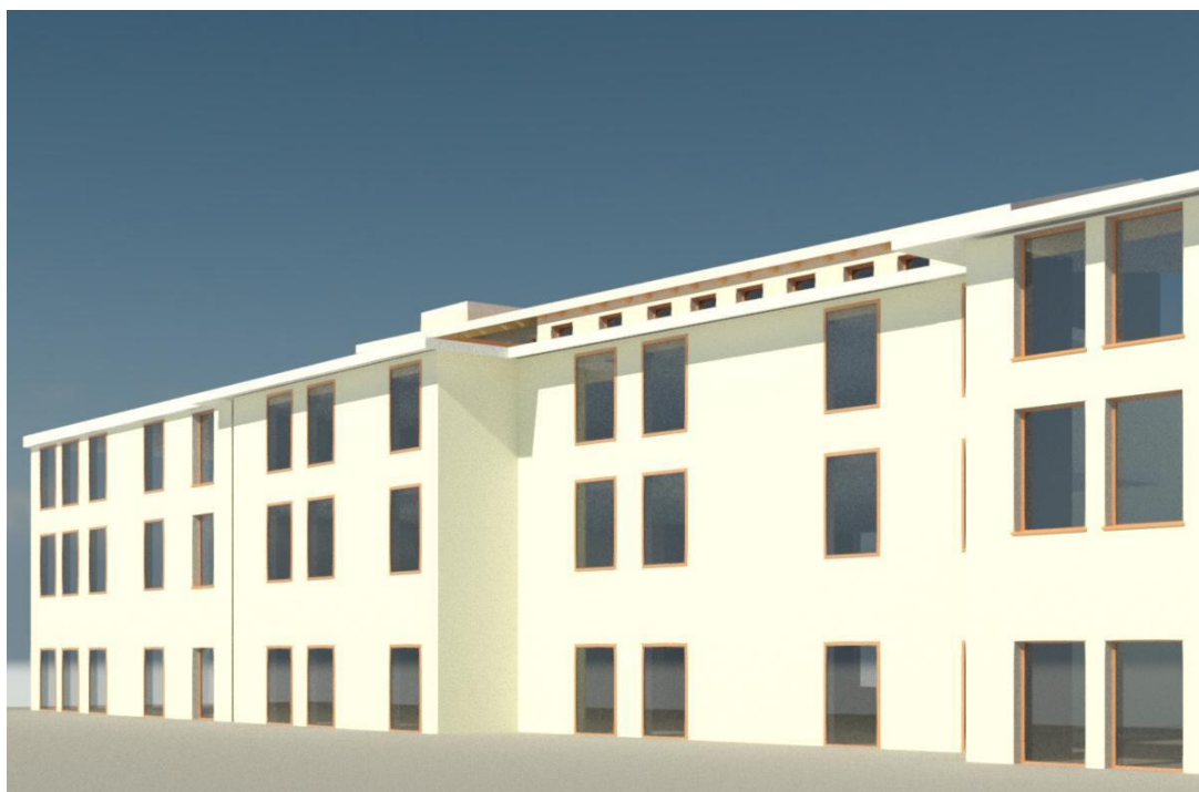
Vista 2 – prospetto ovest