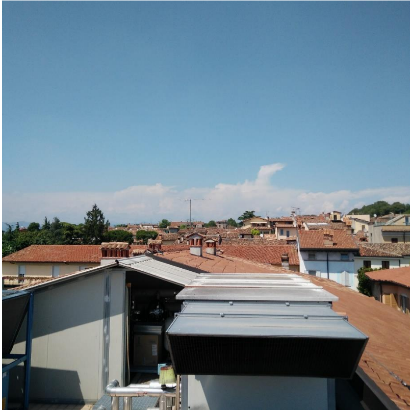
Vista 1 – Copertura, locale macchine