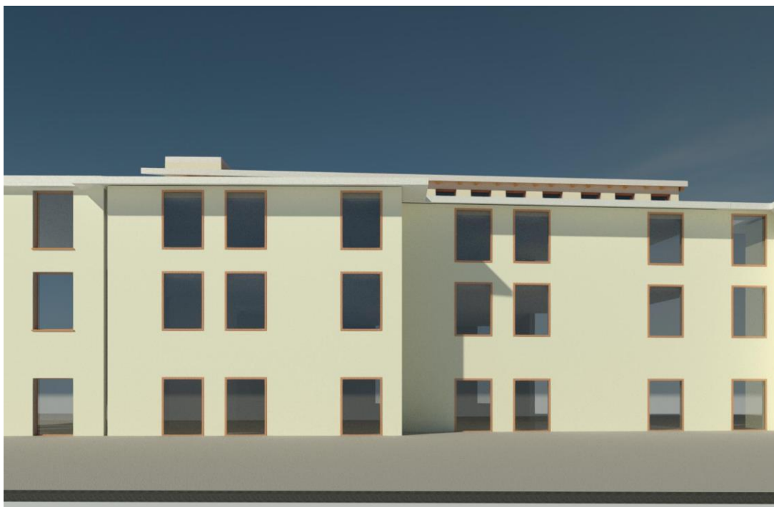
Vista 1 –prospetto ovest dal cortile interno