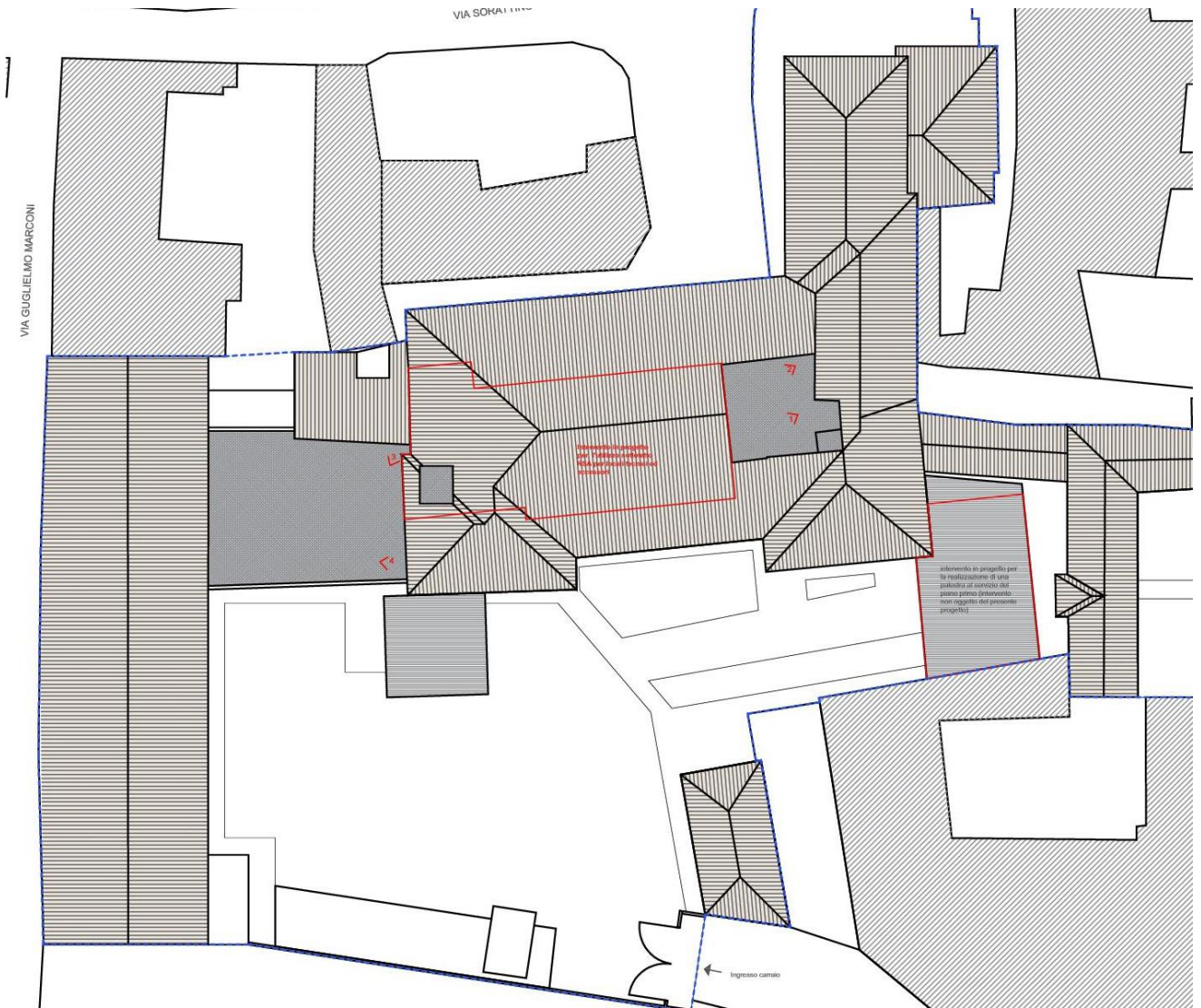
Planimetria Inquadramento fotografie