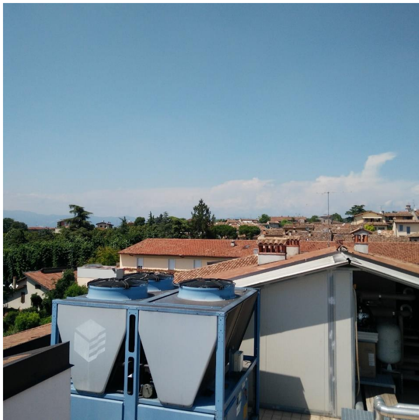
Vista 2 - Copertura