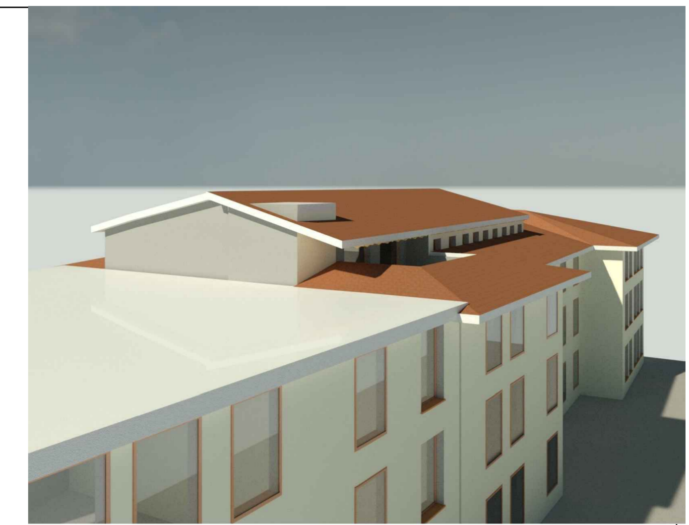
vista esterna copertura - progetto