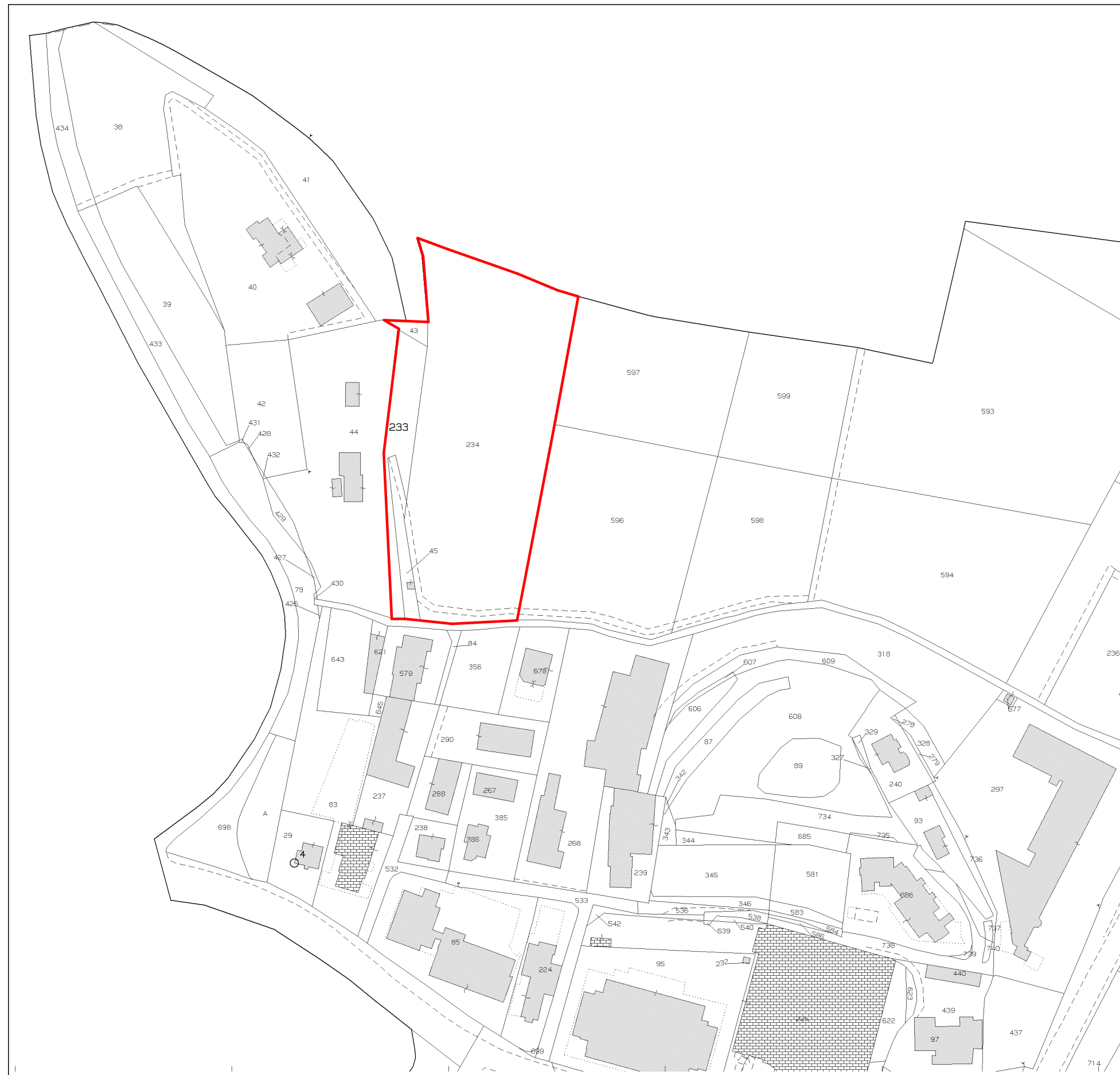
Comune di Lonato del Garda (BS) - Estratto Mappa 1:2000 - Fg.24 - Mapp. 43 - 45 - 233 - 234