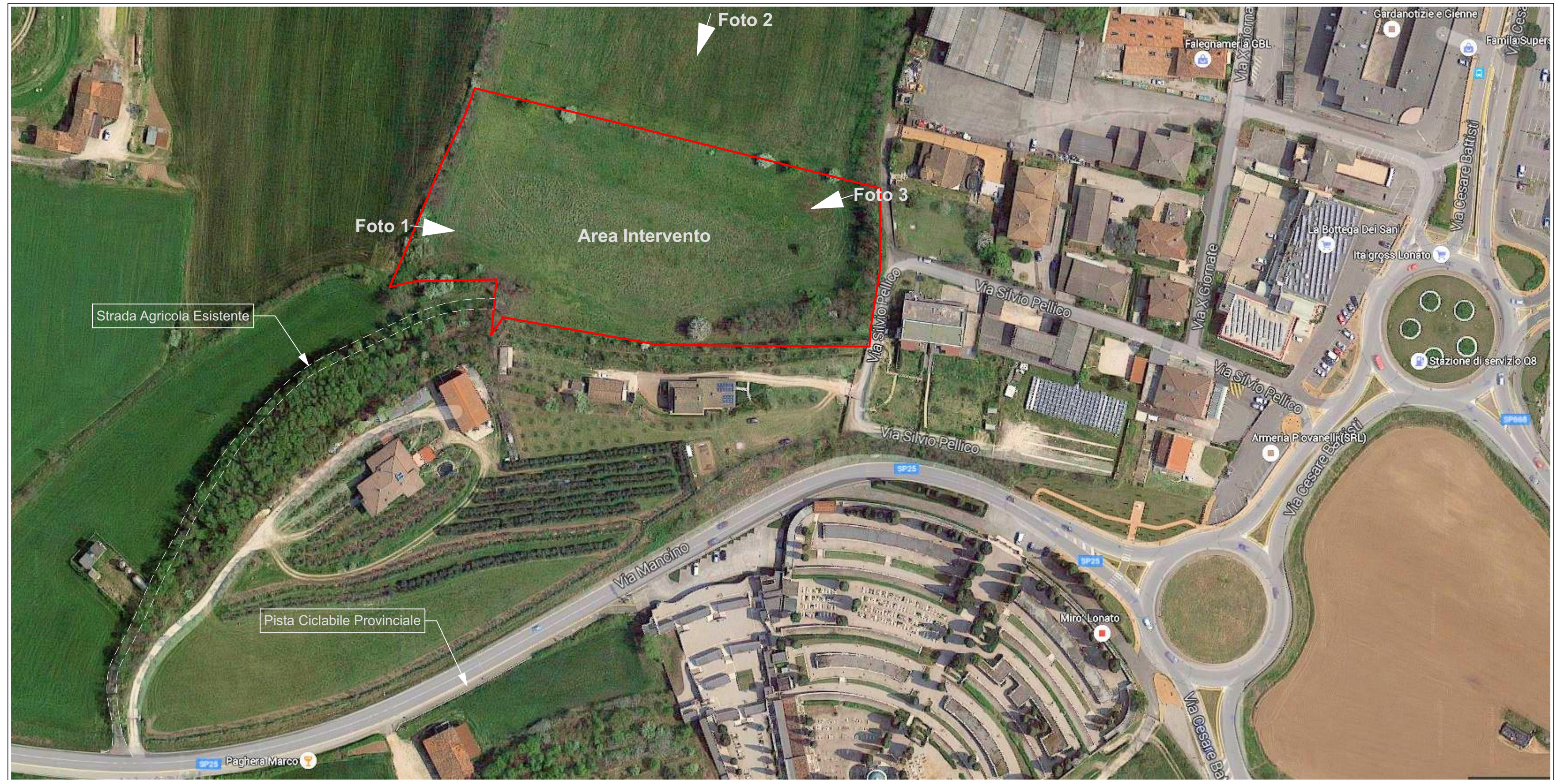
Comune di Lonato del Garda (BS) - Vista Aerea